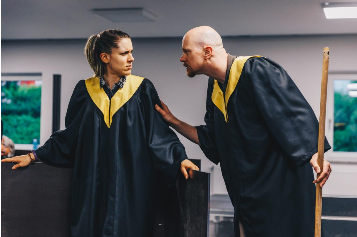
Proben-Foto, © by Julia Lormis