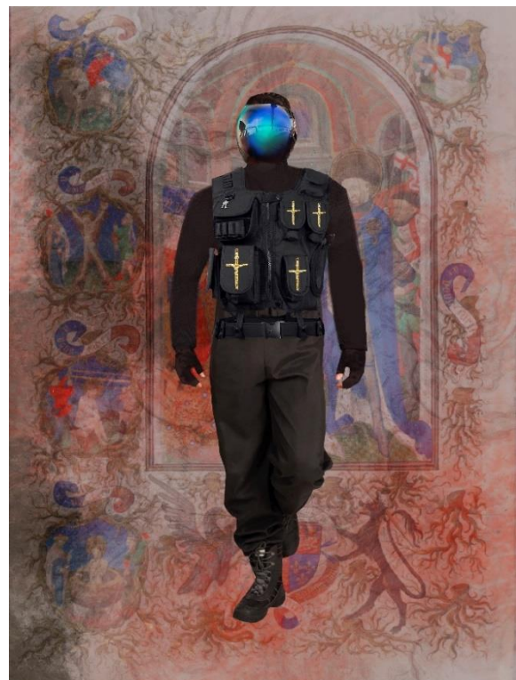
Hauptmann-Figurine, © by Sandra Becker

E-Mail theaterpaedagogik@gandersheimer-domfestspiele.de