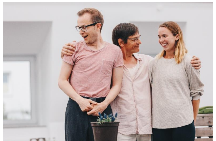
Proben-Foto, © by Julia Lormis