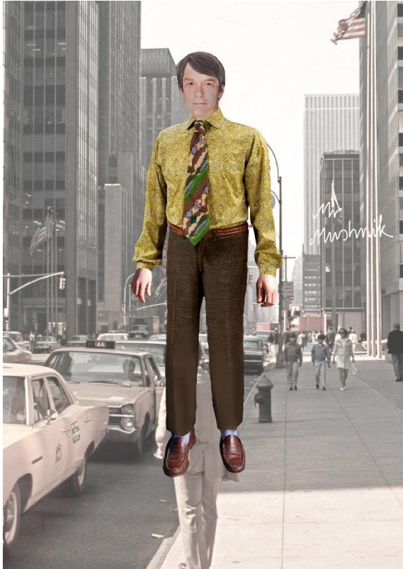
Mr. Mushnik-Figurine, © by Sandra Becker